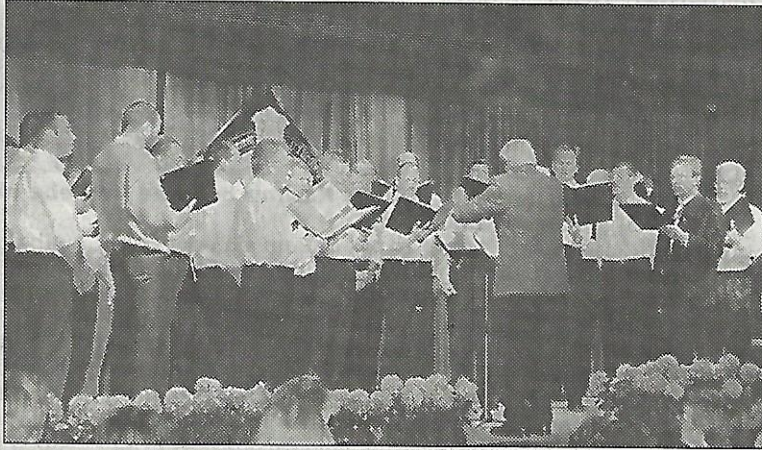
Paten- und Gastvereine sangen den Hochstädtern ein Ständchen zum 50. Geburtstag